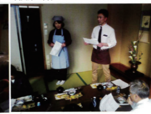
紫波支部 新メニュー開発セミナー