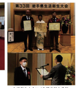
生活衛生大会にて各種表彰を受賞