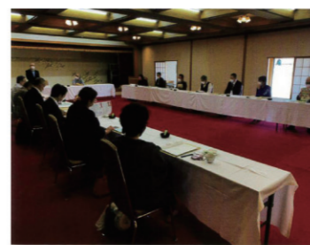
れすたらん文化にてコロナ禍での総会