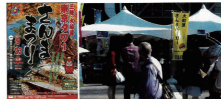
東京都で開催 さんままつりに出店、 大船渡のさんまバーガーを販売