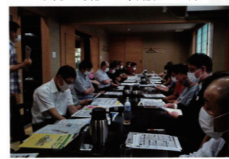
陸前高田支部 HACCP講習会