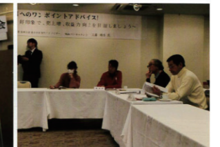
セイエイ塾 in 釜石