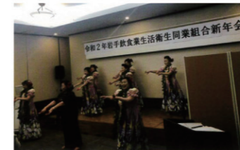
大船渡温泉にて新年会