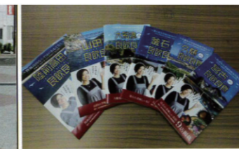
東日本大震災に対する支援事業 沿岸版飲食店ガイドマップ「良飲良食」発行