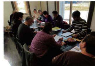
陸丸にて開催 理事会及び監査会