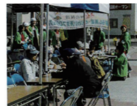
野田村にて行われた復興支援の炊き出し