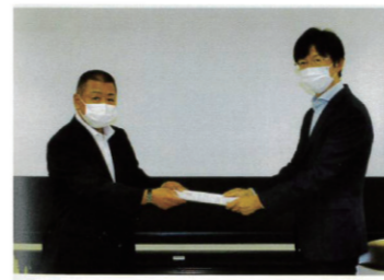
県知事へ陳情書提出