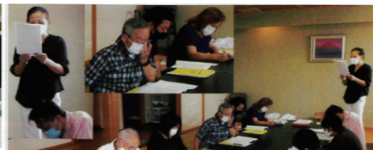
一関支部 会議の様子