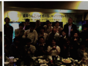
盛岡支部 盛岡りんごハイボールキックオフセレモニー