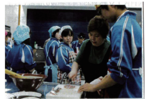
大船渡支部・釜石支部 中学校にて料理教室