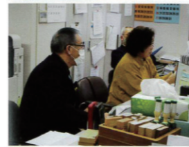
コロナウイルス対策 オンライン講習会