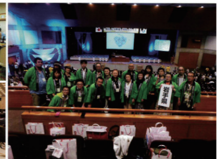
各都道府県で開催された全国大会へ参加